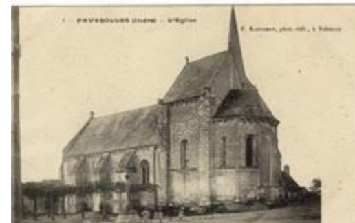
[vue de l'église de Faveroles dans les années 1900 - 1910]